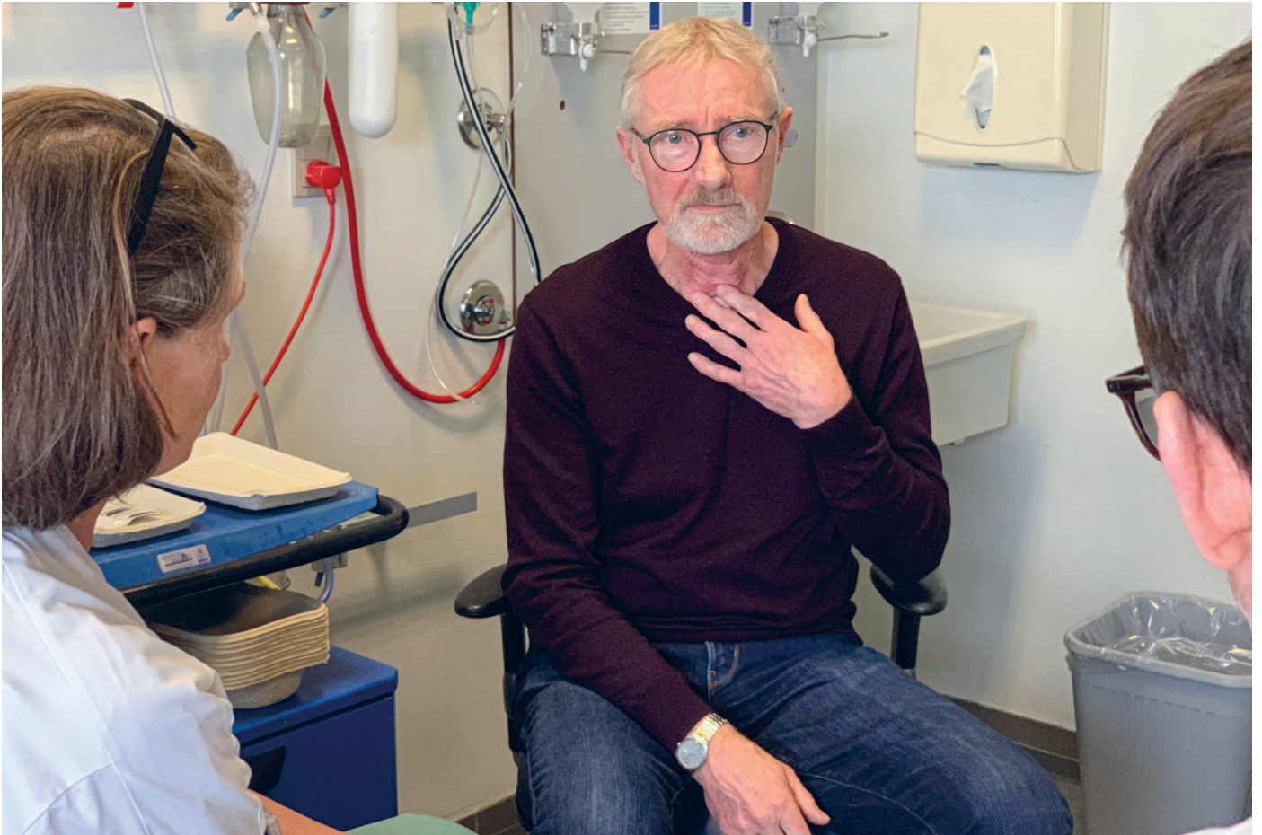
Samtale mellem læger og patient på Rigshospitalet efter velgennemført behandling for kræft.