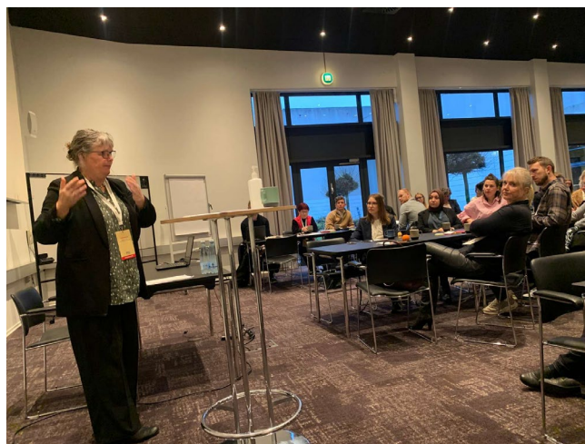
Patientambassadørerne gav deres perspektiv undervejs, ligesom deres historier blev brugt aktivt på konferencen.