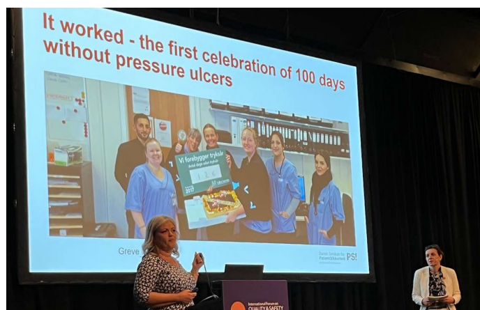
PS! havde en stor aktie i International Forum Copenhagen 2023 – som strategisk partner, oplægsholder, præsentation af keynotes, mv.