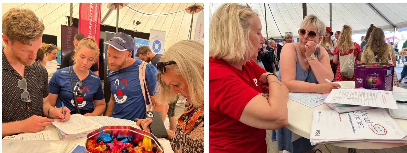
Mange interesserede borgere og sundhedsprofessionelle var forbi vores stand til en snak om patientsikkerhed.

At Dansk Selskab for Patientsikkerhed kan og skal fungere som en organisatorisk ramme for patientsikkerhedsarbejdet viste sig igen i 2023 i form af den omfattende netværksdannelse mellem bestyrelsesorganisationerne på Folkemødet, bl.a. ved den bestyrelsesmiddag PS! bød på torsdag aften i Allinge.