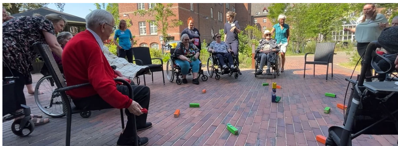
PS! besøgte Afdelingen for Øjensygdomme på Glostrup Hospital og Plejecenter Klarahus i Københavns Kommune på Hvad er vigtigt for dig?-dagen i 2023.