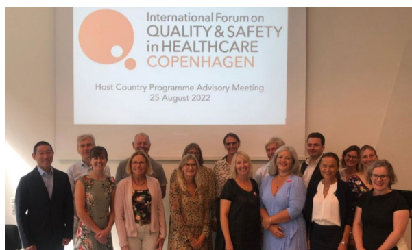
Den danske programkomité har mødtes til flere møder for at forberede International Forum Copenhagen 2023