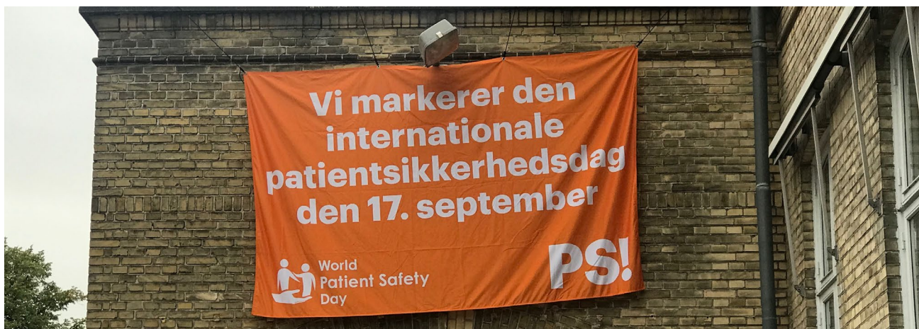
Vi hængte et banner på PS! kontorbygning på Frederiksberg for at markere den internationale patientsikkerhedsdag.

Den internationale patientsikkerhedsdag blev afholdt første gang i 2019, hvor PS! samtidig stiftede Patientsikkerhedsprisen. Det første år gik prisen til patientambassadørerne, som herefter påtog sig opgaven at uddele prisen sammen med PS!.