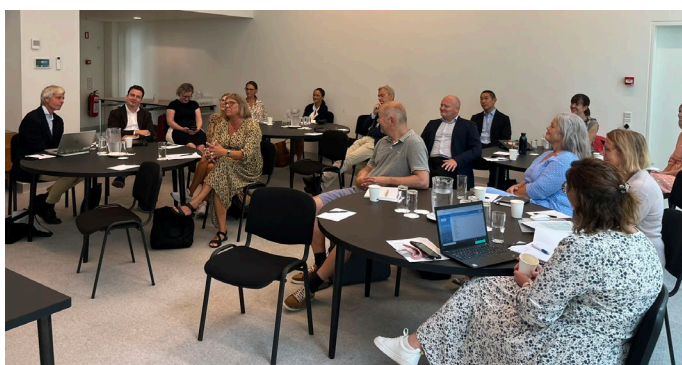
Den 25. august 2022 mødtes den danske programkomité for første gang i Bella Centeret i København med repræsentanter fra IHI og BMJ.