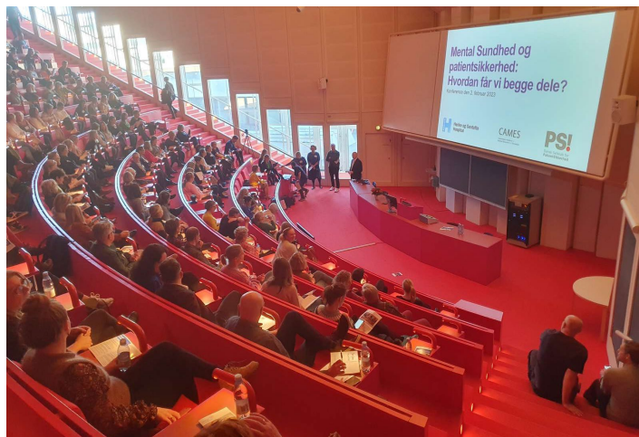
300 deltagere var samlet til konference for at høre, hvordan vi kan få mental sundhed og patientsikkerhed på samme tid.

Læs om Mental sundhed for sundhedsprofessionelle på patientsikkerhed.dk/mentalsundhed